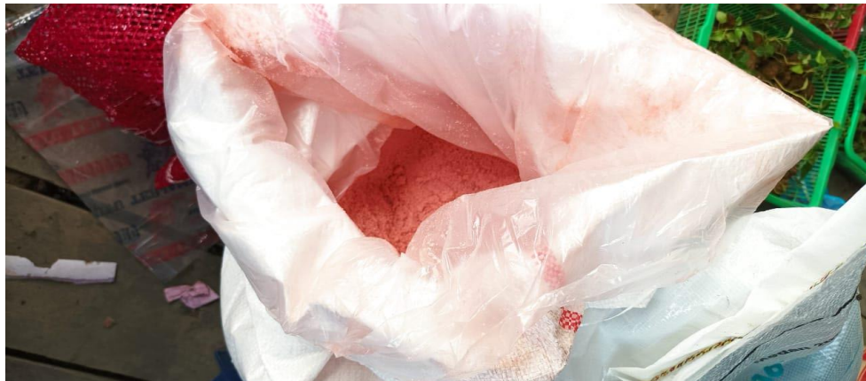
Foto Usaha Saprotan