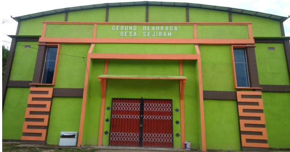
Foto tempat Kantin dan GOR