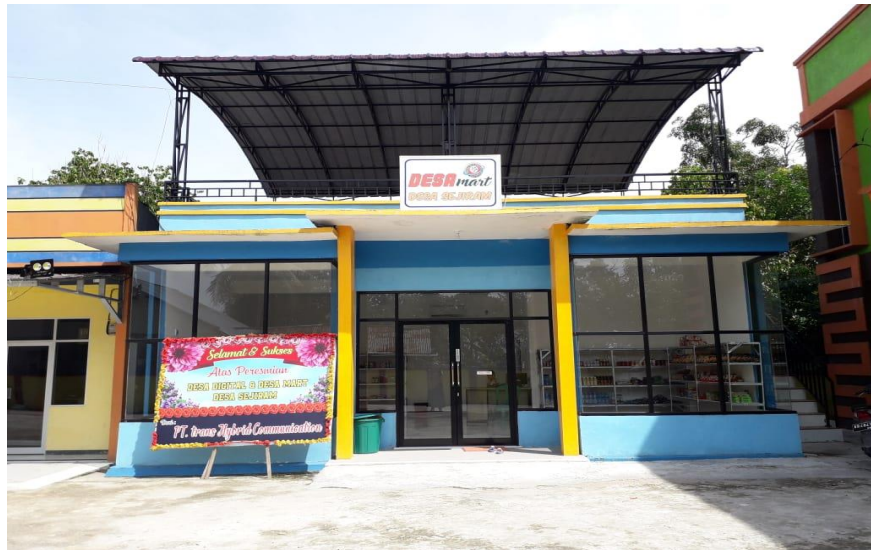
Unit Desa Mart