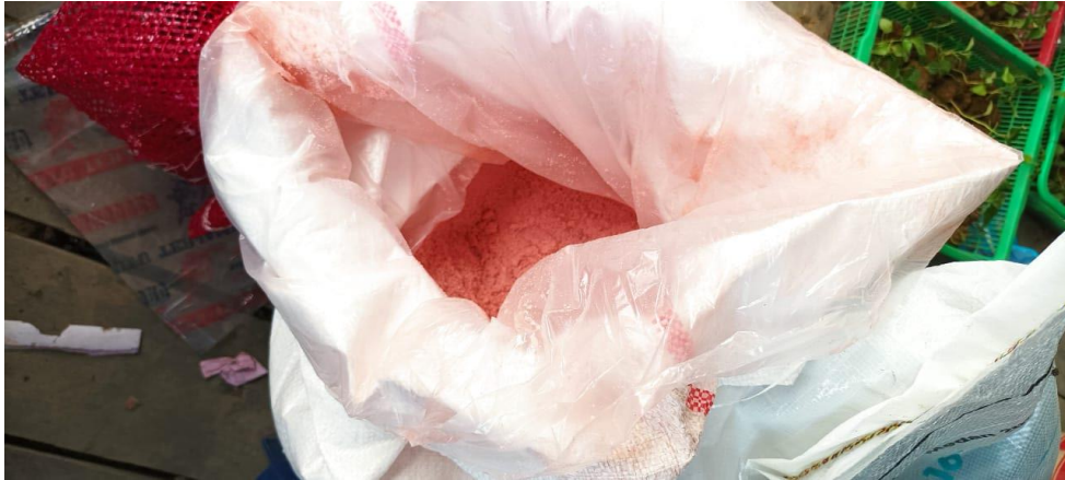
Foto Usaha Saprotan