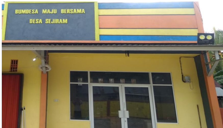
Foto tempat Sablon